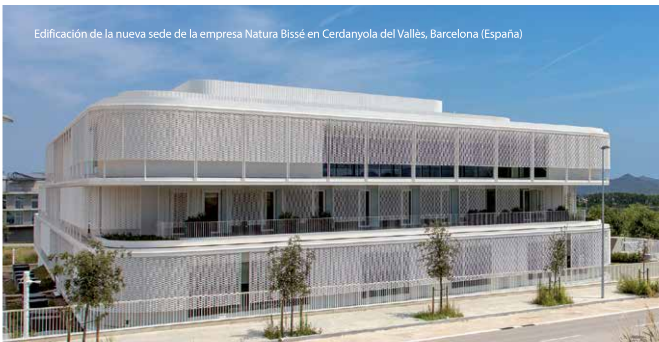
Edificación de la nueva sede de la empresa Natura Bissé en Cerdanyola del Vallès, Barcelona (España)

COMSA Corporación es un grupo global de desarrollo de infraestructuras, ingeniería industrial y servicios con 130 años de experiencia, que pone al servicio de la sociedad su conocimiento en el desarrollo de obras de gran envergadura y alto componente tecnológico en las que la innovación desempeña un rol fundamental en tanto que motor de crecimiento y generación de soluciones sostenibles.